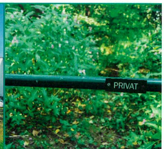
Möglicher Verlauf an der Floßwiese