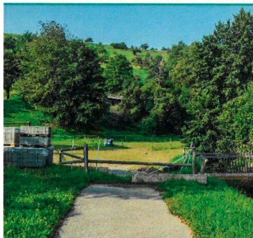
Möglicher Verlauf an der Hofwiese

Abschnitt 11B , als Radstreifen entlang der Roßbacher Straße bis in das Oberdorf